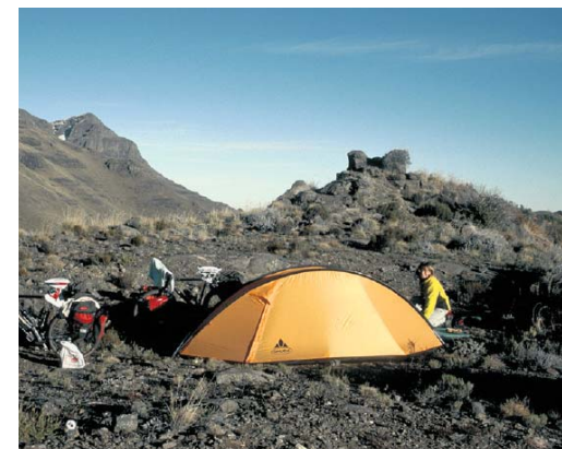
Slapen op 3.000 meter hoogte in Lesotho