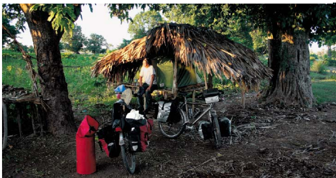
Kamperen in een wachthuisje bij een rijstveld in Myanmar, het voormalige Birma

Vorige week werden bij Rome twee Nederlandse wildkampeerders beroofd. Volgens wereldfietser Theo Jorna had het paar ‘domme pech’. „Overvallers struinen geen afgelegen vlakke af.”