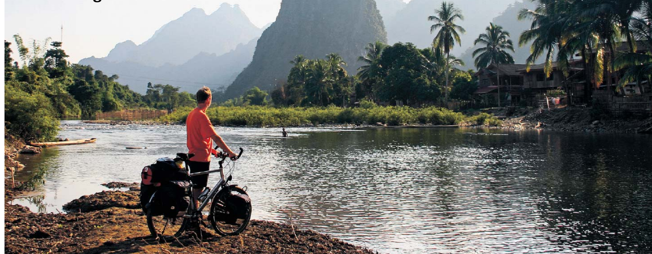
Fietsen langs de oever van de Nam Xong in Laos

vragen of je ergens mag staan. Als je die niet ziet, dan zoek je zelf een plekje.” Uit de verhalen die Jorna hoort van fietsers die onderweg zijn lastiggevalen, blijkt altijd dat zij op aandraden van iemand op die plek waren gaan staan.